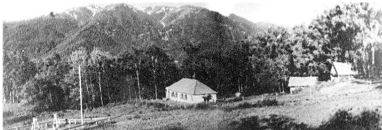
Кишинский зубропарк, 1940 г.

История эта такова: «С воздуха, пока деревья не сбросили листву, наш зубропарк трудно было обнаружить. Стояла для зубров мы надежно замаскировали. Огонь разводили только по ночам, чтобы дым не выдал. Однако все чаще в небе зависали немецкие самолеты-разведчики. Мы поняли, что нас ищут, и не только с воздуха. Встали сра-